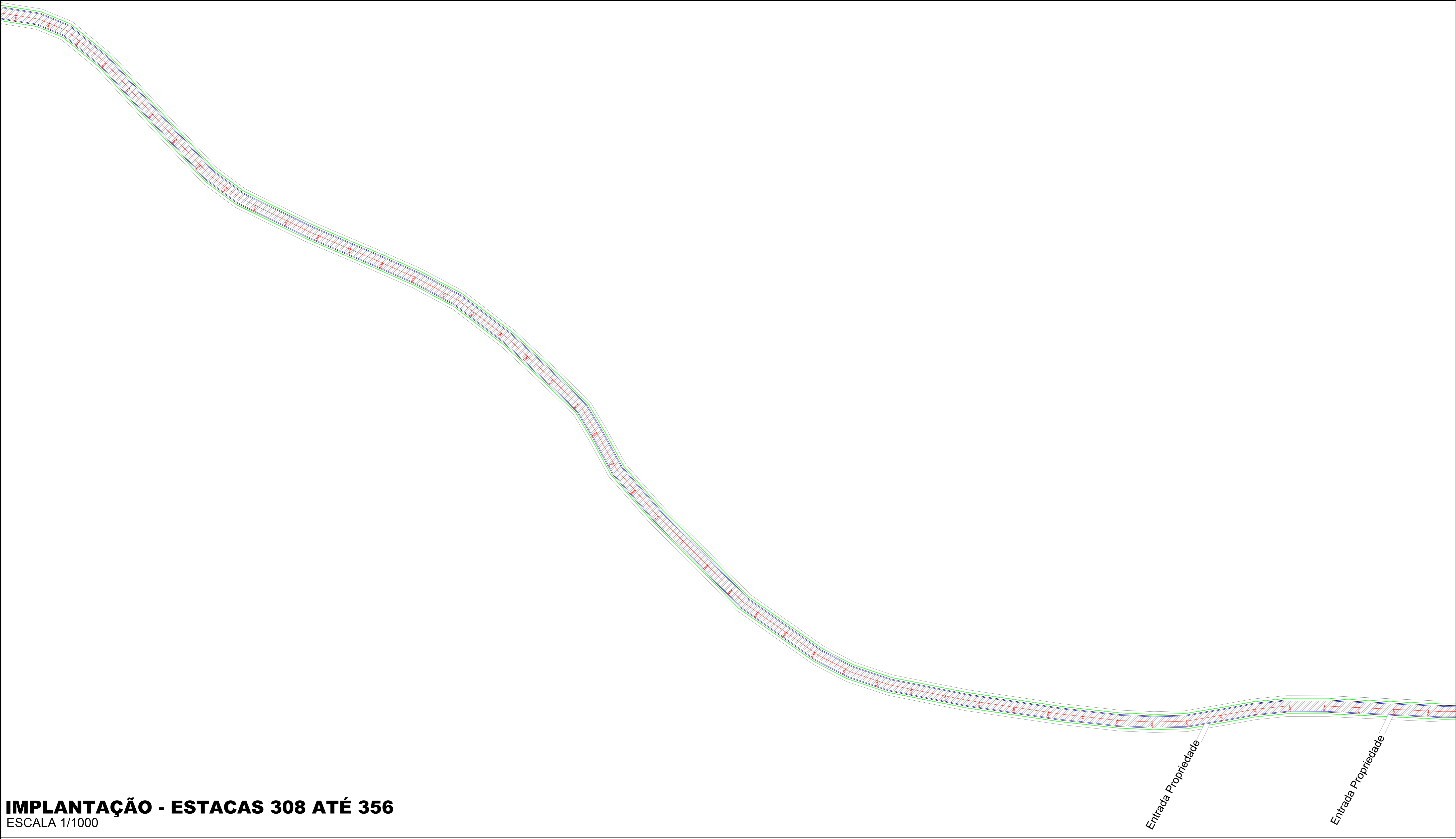
IMPLANTAÇÃO - ESTACAS 308 ATÉ 356 ESCALA 1/1000